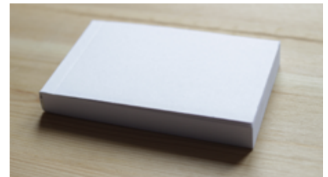
koupený blok na flipbook

Protože při listování flipbookem je dobře viditelná jen asi polovina formátu, kreslil jsem scénář do čtverců. Počítal jsem s 90 políčky a rozvrhl si časování. Do flipbooku jsem si tužkou očísloval každý pátý list.